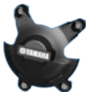
YZF R1 Protection de carter moteur