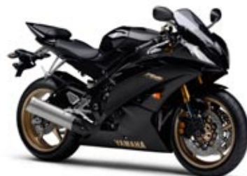
Midnight Black (SMX)