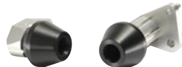
Roulettes de protection