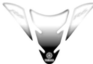
YZF R6 Protection de réservoir