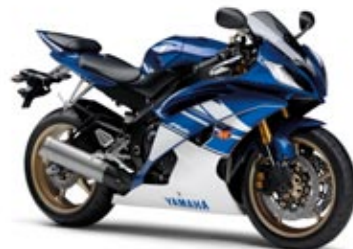
Yamaha blue (DPBMC)