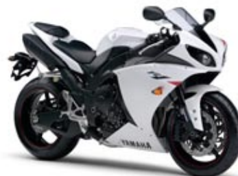
Competition White (BWC1)