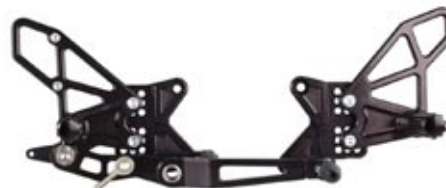
R1 & R6 Commandes reculées

Yamaha vous recommande l'utilisation des accessoires et gamme vestimentaire Yamaha. Retrouvez tous les accessoires Yamaha pour équiper votre supersport dans notre catalogue accessoires 2010 à demander chez votre Concessionnaire Yamaha ou allez sur le site: www.yamaha-motor.fr/accessoires