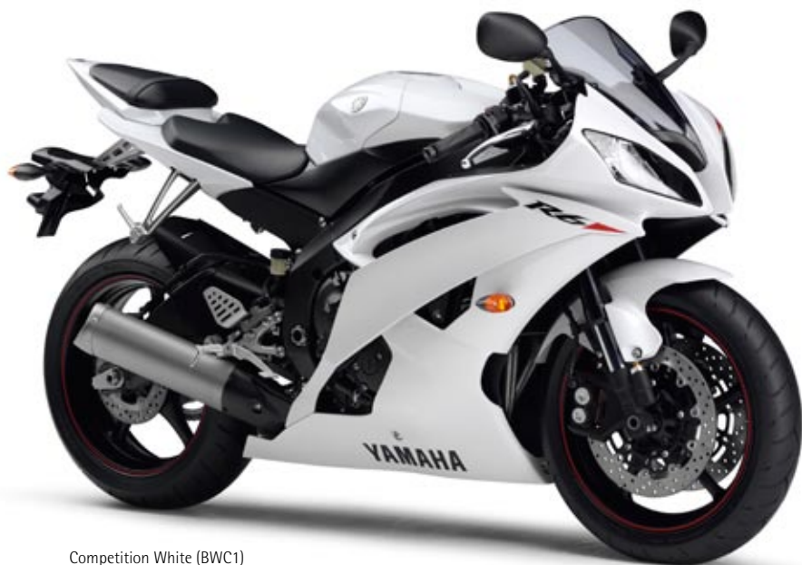
Competition White (BWC1)

Sur la R6, chaque élément vise un même objectif : le plaisir et l'efficacité absolue en courbe, nés d'une parfaite interaction pilote/machine.