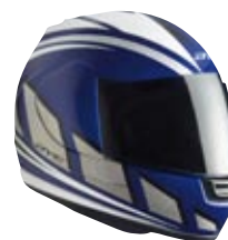
Casque BYE speedlight