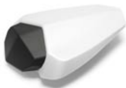
YZF R1 Capot de selle