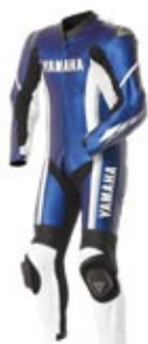
Combinaison en cuir Speedblock

Choisissez parmi les nombreux éléments adaptables : bulles, capotages de selle, roulettes de protection, béquilles d'atelier avant et arrière... Ou encore la gamme vestimentaire: ensembles de cuir en une ou deux pièces, gants, blousons, T-shirts et bien d'autres encore. Rendez-vous chez votre concessionnaire Yamaha ou sur le site www.yamaha-motor.fr/accessoires